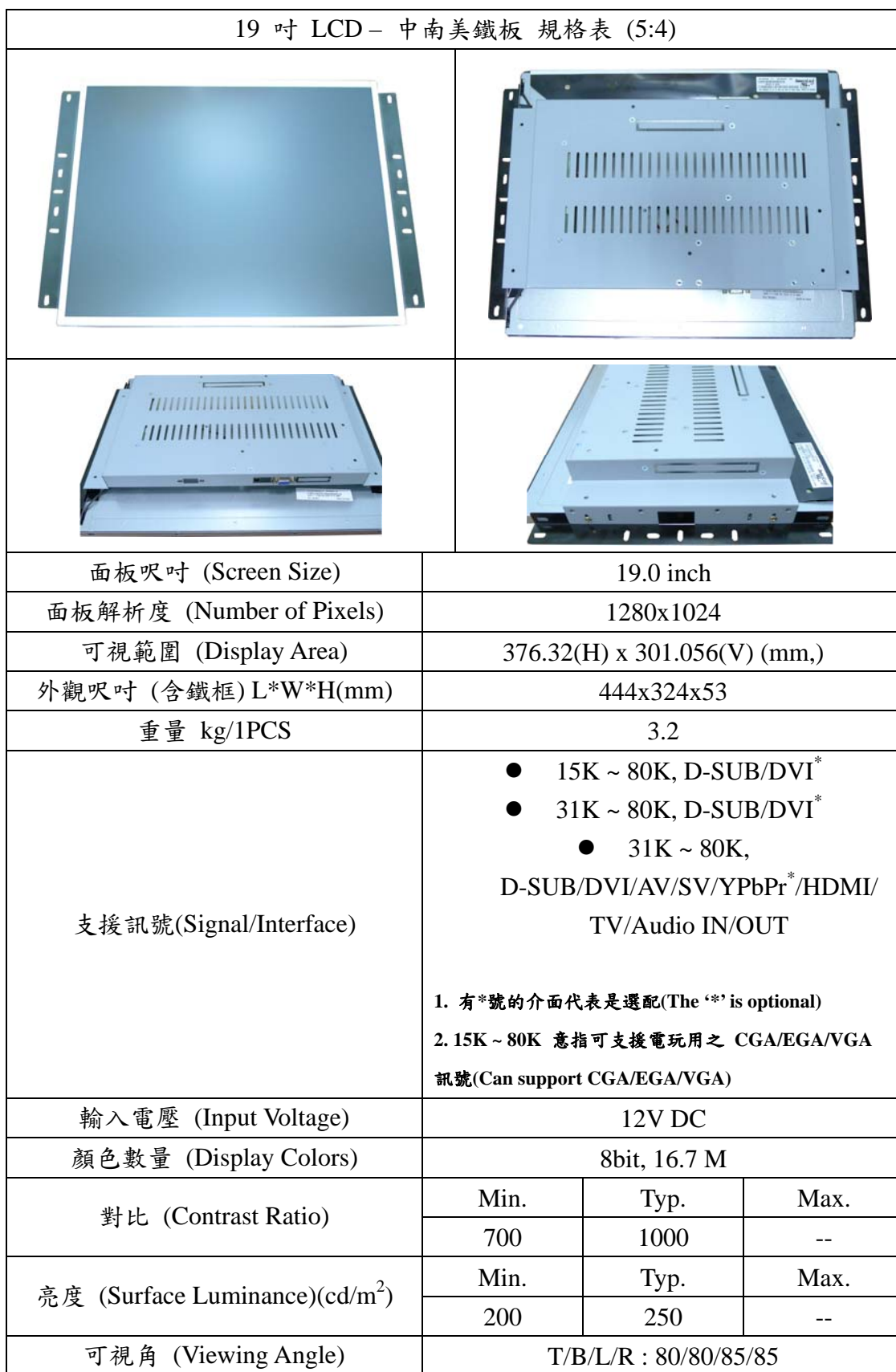
19 吋 LCD – 中南美鐵板 規格表 (5:4)